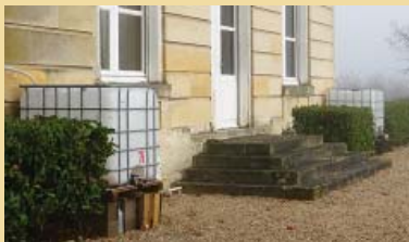
On récupère l'eau de pluie

Le deuxième confinement a été source de recherches pour savoir comment faire tout de même tourner un peu le magasin. Après conseils et renseignements, nous avons mis en ligne la partie librairie. Nous sommes donc présentes sur le portail « Les Libraires.fr » et nous sommes également visibles sur « Les Librairies indépendantes » Nous fonctionnons en « click and collect » ou bien par envoi. Là aussi, cela permet d'élargir nos liens, car à chaque commande nous pouvons entrer en contact avec la personne.