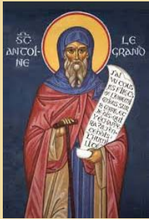
Saint Antoine le Grand