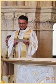
P. Cyril nous quitte