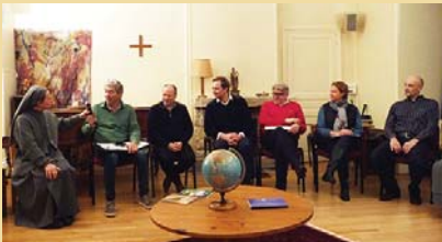
Deux listes se présentent aux élections municipales