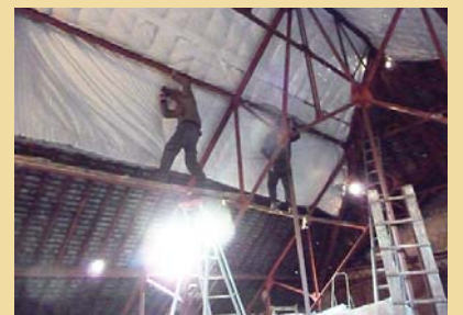
Gros travail d'isolation