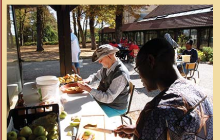
Il y a des fruits cette année : tout le monde se met à l'épluchage