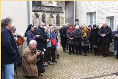
Installation de nos sœurs Amantes de la Croix à AY