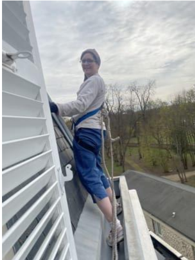
Un autre genre de sport, le débouchage des gouttières....