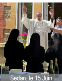
Sedan, le 15 Juin