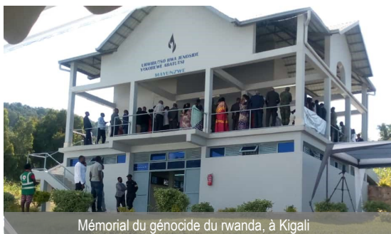
Mémorial du génocide du Rwanda, à Kigali